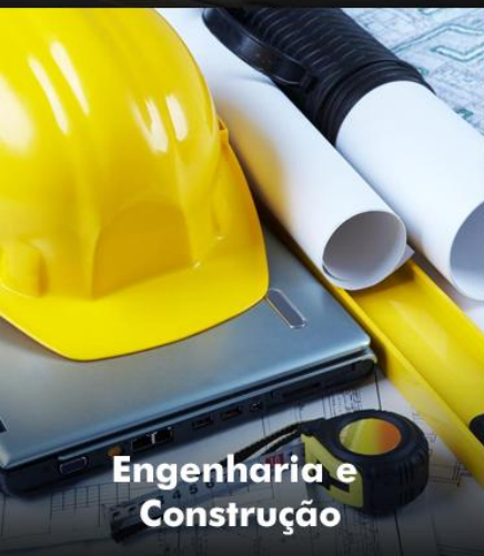
Engenharia e Construção