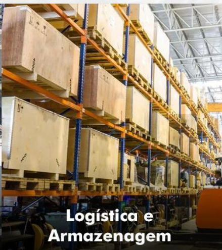
Logística e Armazenagem