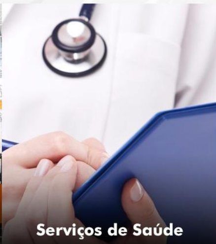
Serviços de Saúde